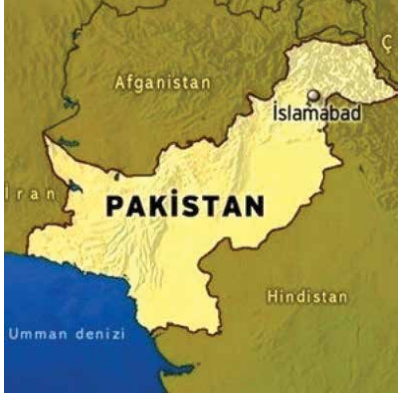
Harita 1. Pakistan Haritası

İklim olarak ülkede 3 ana tip iklim hüküm sürmektedir. Bunlar; Doğu kesimde muson yağmurlarının hüküm sürdüğü muson iklimi, güney kısımda tropikal iklim ve batı Pakistan'da karasal iklim tipine benzer iklim yaşanmaktadır.