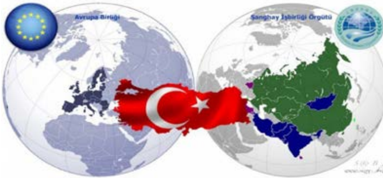
Harita 1. AB, Türkiye ve ŞİÖ