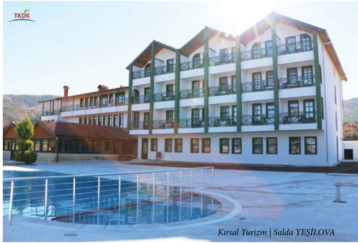
Kırsal Turizm | Salda YEŞİLOVA

Hibe oranlarının %70'e çıktığı yeni dönem IPARD II Programı kapsamında ise 1'nci Çağrı Döneminde başvuruları alınan 156 adet projeden 37'si sözleşme imzalamaya hak kazandı. 37 projenin toplam yatırım miktarı 20 Milyonun üzerinde olup, başvuru alan sektöre göre yüzde 65 - 70 oranında hibe alabileceklerdir. Bu 37 projenin sektörel dağılımına göz atacak olursak: "5 adet süt üreten tarımsal işletme, 3 adet besi işletmesi, 1 adet istiridye mantarı üretimi, 1 adet makine parkı projesi, 6 adet kırsal turizm ve 21 adet tıbbi aromatik bitki yetiştiriciliği projesi yer almaktadır. Bu projelerle öncelikle ilimiz ve ülkemiz ekonomi-