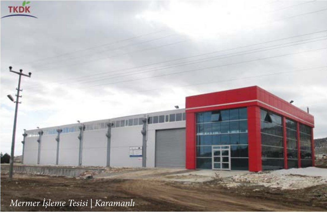
Mermer İşleme Tesisi | Karamanlı

Proje Danışmanlık Hizmetleri' sektöründe hizmet kalitesinin artırılması, hizmet sağlayıcılarının kayıt altında alınması ihtiyacının karşılanması amacıyla işbirliği protokolü imzaladı. Temel amacı proje hazırlama kapasitesinin artırılması ve kaynakların etkin şekilde kullanılarak hazırlanan projelerle IPARD desteklerinden yararlanmak isteyen girişimcilere etkin, kaliteli ve çözüm odaklı danışmanlık hizmetleri sunmayı hedefleyen bu girişimle kayıt altına alınmış bir danışmanlık sistemini oluşturacağız. Böylece projelerin yetkili danışmanlar ve kurumsallaşmış hizmet sunucular tarafından hazırlanmasıyla vatandaşlarımızın olası