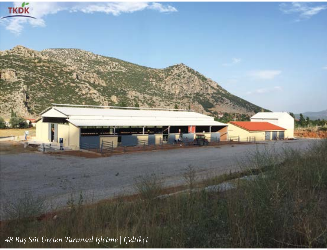
48 Baş Süt Üreten Tarımsal İşletme | Çeltikçi