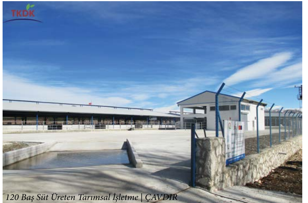
120 Baş Süt Üreten Tarımsal İşletme | ÇAVDIR

Türkiye - AB Mali işbirliğinin bir yansıması olan IPARD Programı ile AB'nin Ortak Tarım Politikasına ilişkin müktesebatı ve kırsal kalkınma yaklaşımları, gerçekleşen bu yatırımlarla ülkemize aktarılmakta, destek alan işletmelerimizin AB standartlarında üretim yapmasına ciddi katkılar sunmaktadır. IPARD fonlarının sağlam mali yönetim prensiplerine uygun olarak, şeffaf ve etkin bir şekilde kullanılması Gıda Tarım ve Hayvancılık Bakanlığımızın ve TKDK'nin en önemli sorumluluklarından olmuştur ve olmaya devam etmektedir. Kurumumuz uluslararası sıkı denetimlere tabi olarak iş ve işlemlerini yürütmekte olup, tüm kontrol süreçleri ve ödemeler AB Akreditasyon Kriterleri gözetilerek en hassas şekilde gerçekleştirilmektedir. Tarım ve Kırsal Kalkınmayı Destekleme Kurumu olarak kırsal kalkınmanın sağlanmasında sürdürülebilirliğin önemini bilinci ile ülkemiz kırsal alanlarının kalkınmasına hizmet etmekten, IPARD Programı destekleri ile zenginleşen ve büyüyen bir ailenin parçası olmaktan gurur duyuyoruz. 2. Çağrı döneminin sonuna gelerek 3. Çağrı dönemi için hazırlık yaptığımız bugünlerde, proje kapasitesinin artması ile birlikte, daha fazla