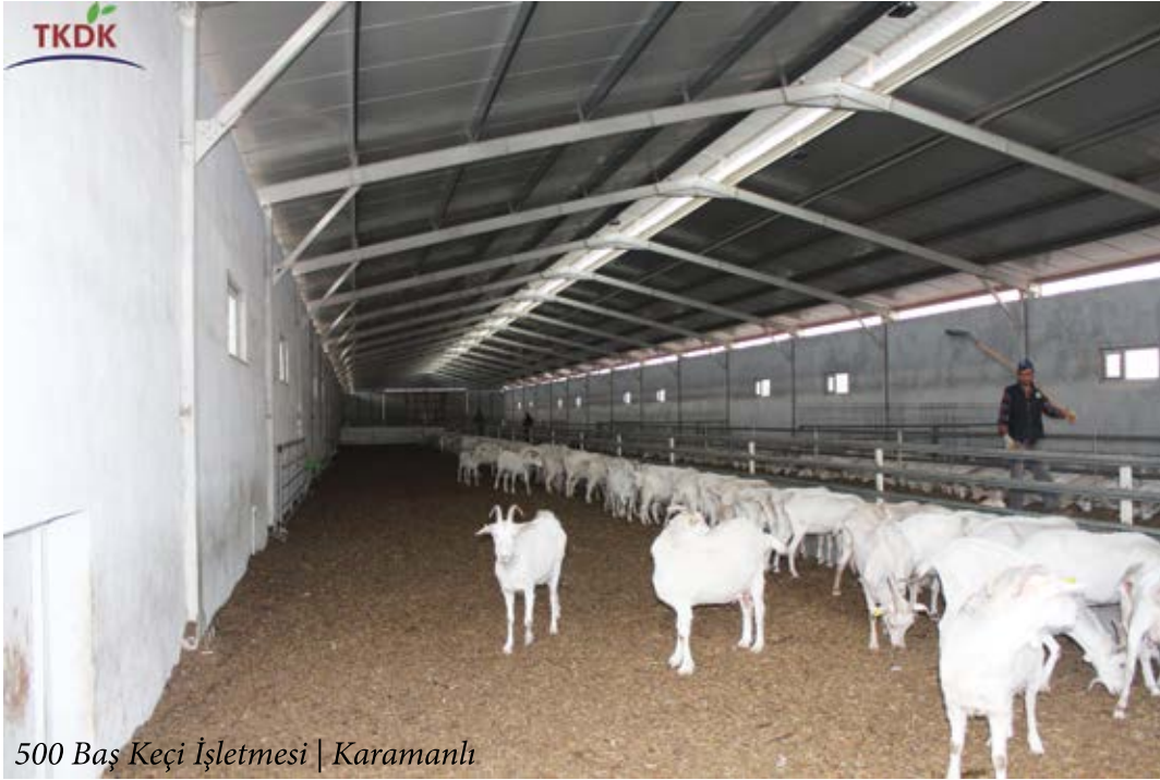
500 Baş Keçi İşletmesi | Karamanlı

de içinde yer aldığı ikinci grupta 22 İl Koordinatörlüğü olmak üzere toplam 42 İl'de çalışmalarını sürdürmektedir. 2011 yılından bugüne IPARD Programını uygulayarak kırsal kalkınma alanında yeni bir sayfa açan TKDK, 31 Aralık 2016 tarihi itibarıyla IPARD-I Programını başarıyla tamamlamış, bu süreçte ülke genelinde toplam 15 proje başvuru çağrı ilanına çıkmış ve 10.693 proje sahibinin yatırımlarının hayat bulmasını sağlamıştır. Yine IPARD I Programında verilen hibelerle