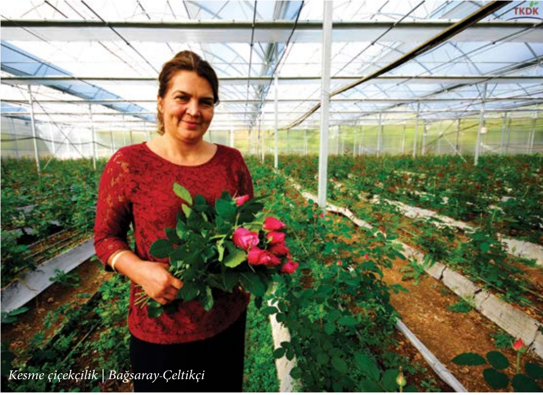
Kesme çiçekçilik | Başsaray-Çeltikçi

sektörlerinden çağrıya çıktığımız 2. Dönemde kurumumuza başvurusunu kabul ettiğimiz 7 projenin toplam yatırım tutarı 18.885.348,57 TL, hibe tutarı ise 8.374.307.00 TL'dir.