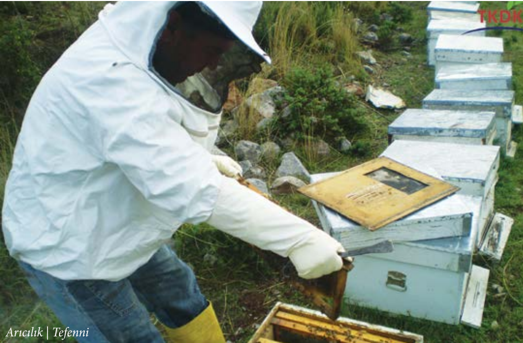
Arıcılık | Tefenni

alanların boşalmasına, kentlerin nüfusunun artmasına ve kırsal alan ile kent arasında dengesiz bir nüfus oranının oluşmasına neden olmuştur. Ayrıca kırsal bölgelerin boşalmasıyla birlikte tarım ve hayvancılık gibi sektörlerde ülkelerin ekonomisinde olumsuz etkiler görülmüştür. Şimdilerde ise kırsal alanlarda iş olanaklarının artması ile birlikte kentten köye bir göçün başladığına tanık oluyoruz. Devletimizin vermiş olduğu hibe ve krediler, yatırımcıları “kırsala dönüş” e teşvik etme amacı güderek, köy ve kent arasındaki uçurumu en aza indirmek adına kilit rol oynuyor. Bakanlığımızın ve Kurumumuzun başrolünü üstlendiği bu alanda, ülkemizin kalkınma manasında kritik bir atılım gerçekleştirdiği malum. Bu hamleyi gerçekleştirmek için kamu kaynaklarıyla beraber, Avrupa Birliği, milli ve uluslararası kaynaklarla desteklenen destekleme mekanizmaları mevcut. Tarım ve Kırsal Kalkınmayı Destekleme Kurumu da proje uygulama ve yürütme anlayışını geliştiren ciddi mekanizmalardan birisidir. Gıda Tarım ve Hayvancılık Bakanlığı’nın ilgili kuruluşu olarak 2007 yılında kurulan Tarım Ve Kırsal Kalkınmayı Destekleme Kurumu (TKDK), 2009 yılında 20 İl Koordinatörlüğü, 2012 yılında İlimizin